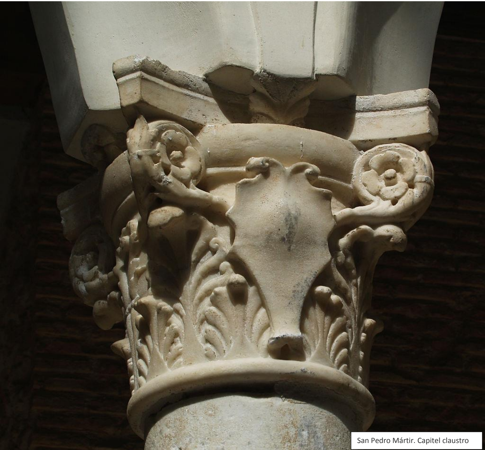
San Pedro Mártir. Capitel claustro

UNIVERSIDAD DE CASTILLA-LA MANCHA INVENTARIO DE BIENES INMUEBLES